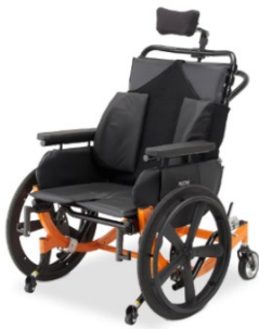
(illustré avec accessoires en option)