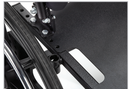
Le plateau solide du siège permet d'accueillir de nombreux sièges.