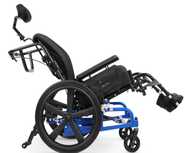
L'inclinaison vers l'arrière améliore la posture et contribue à une meilleure répartition de la pression.