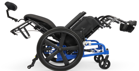
L'inclinaison du siège à pivot avant maintient une de vue vers l'avant, favorisant l'interaction sociale / l'échange.