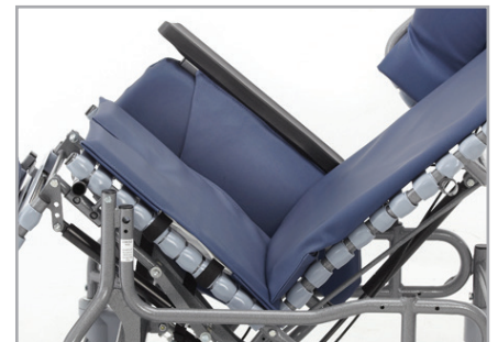
Les accoudoirs amovibles permettent des déplacements sécuritaires pour les intervenants et les patients