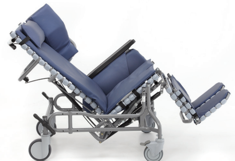
L'inclinaison du siège vers l'arrière concourt effectivement à l'ouverture du diaphragme et facilite la respiration, la digestion et le bon fonctionnement des organes.