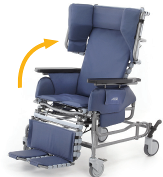
Le mécanisme d'inclinaison facilite le repositionnement des utilisateurs