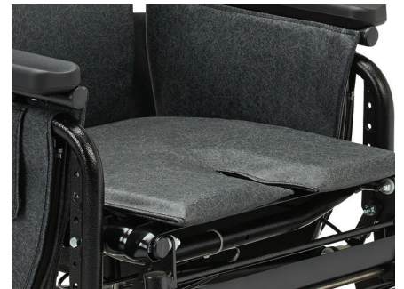
La hauteur de la surface d'assise réglable adapte la ligne médiane pour prendre en charge les utilisateurs à plusieurs niveaux de soins