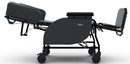
La fonctionnalité d'inclinaison et d'inclinaison complète offre un positionnement supérieur