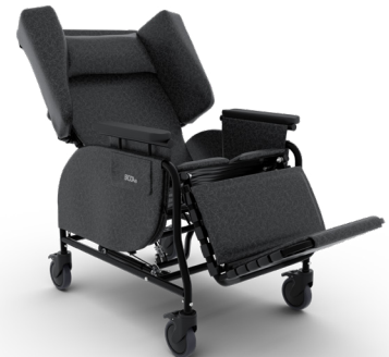
L'inclinaison vers l'arrière améliore la posture et contribue à une meilleure répartition de la pression